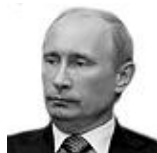
Владимир Путин, Президент Российской Федерации

«Нужно, чтобы инновация, модернизация проникла в мозг каждого конкретного гражданина».