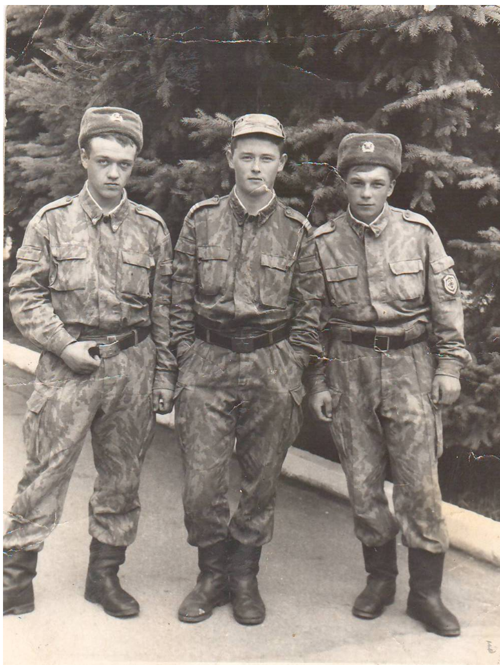
Первые дни службы в пограничной части Особого назначения 3810 г. Железноводска декабрь 1994г.