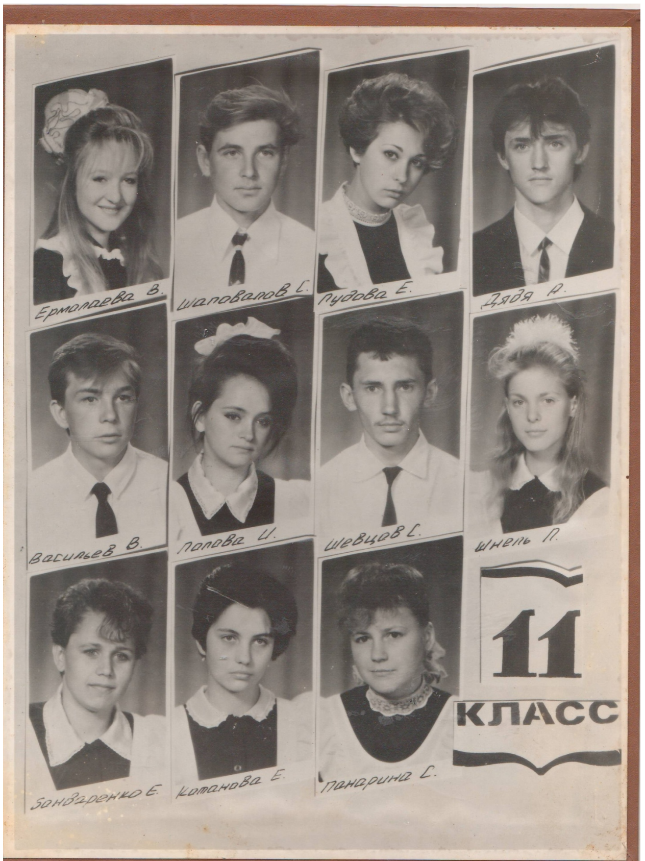
Страница из выпускного альбома, апрель 1994 года, 11 класс